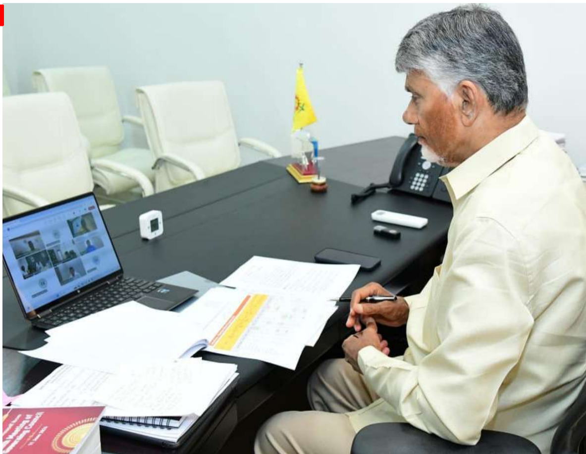
సీఎం సమీక్షించారు. ఉపాధి హామీ నిధులను పూర్తిస్థాయిలో సద్వినియోగం చేసుకునేలా జల ధార పనులు చేపట్టాలని ఆదేశించారు. ఉపాధి హామీ