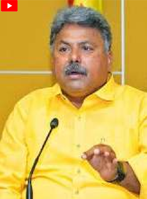
జగన్మోహన్ రెడ్డి వల్ల రాయలసీమకు ఇరిగేషన్, ఉపాధి పరంగా తీవ్ర నష్టం జరిగిందని అన్నారు. 2024 ఎన్నికలలో రాయలసీమలో వైసీపీని ఏడు స్థానాలకే ప్రజలు పరిమితం చేశారని, కడప జిల్లాలో కూడా ఎన్నో కుటమి ఏడు స్థానాలు