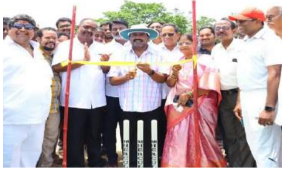
ప్రతిభాపంతులైన క్రీడాకారులను వెలికితీయడం కోసం ఇలాంటి టోర్నమెంట్లు ఎంతో ఉపయోగపడతాయని పేర్కొన్నారు.

బ్యాటింగ్ చేసి, తొలి బంతిని ఆడి టోర్నమెంట్ను అధికారికంగా ప్రారంభించారు. జిల్లా నలుమూలల నుంచి పాల్గొన్న జట్లకు స్వాగతం పలికారు. క్రీడలను ఆరోగ్యకరమైన పోటీలకు వేదికగా భావించాలని సూచించారు. యువత క్రీడల్లో రాణించి రాష్ట్ర, జాతీయ స్థాయిలో గుర్తింపు పొందాలని ఆకాంక్షించారు. ప్రభుత్వం కూడా క్రీడా అభివృద్ధికి ప్రత్యేక ప్రాధాన్యత ఇస్తోందన్నారు. గ్రామీణ ప్రాంతాల నుంచి