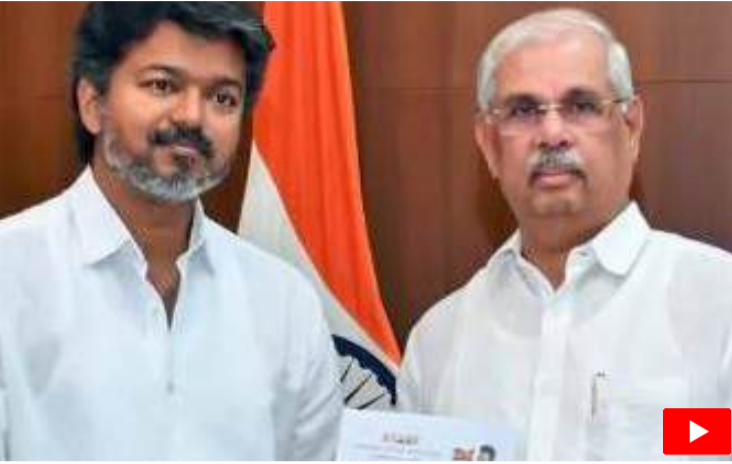
టీవీకే అధినేత విజయ్ కు తమిళనాడు గవర్నర్ ఆహ్వానం

పార్టీతో ముందుకెళ్తుందనే విషయంపై స్పష్టత లేకపోవడంతో రెండు వారాల్లో మెజారిటీ నిరూపించుకుంటామని ఆ పార్టీ ఇప్పటికే గవర్నర్ కు కోరింది.