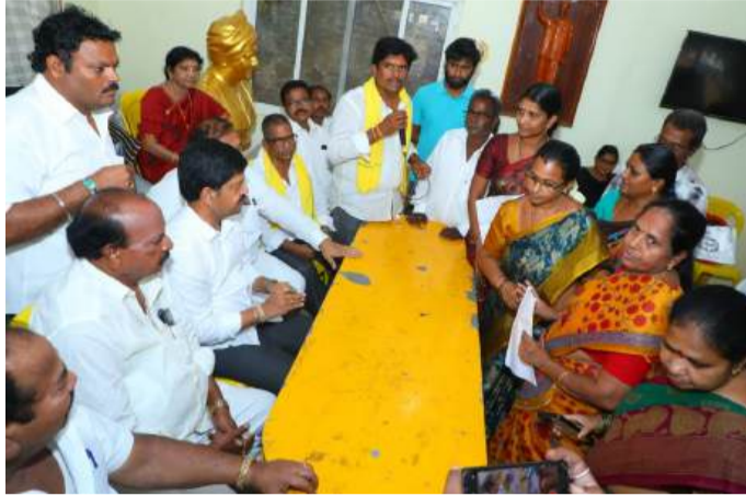
బందరు ప్రజల దౌర్భాగ్యం పేర్ల నాని

మచిలీపట్నం (చైతన్యరథం): ప్రజలకు జవాబుదారీ తనం తో కూడిన పాలన అందించడమే లక్ష్యంగా కూటమి ప్రభుత్వం పని చేస్తోందని గనులు, భూగర్భ వనరులు ఎక్స్లెజ్ శాఖ మంత్రి కొల్లు రవీంద్ర పేర్లొన్నారు. మచిలీపట్నం తెలుగుదేశం పార్టీ కార్యాలయంలో ప్రజాదర్శాబి నిర్వహించి ప్రజల నుంచి అర్జీలు స్వీకరించారు. పలు సమస్యలకు అక్కడే అధికారులతో మాట్లాడి పరిష్కారం చూపించారు. పెన్షన్లు, రేషన్ కార్డుల కోసం వచ్చిన దరఖాస్తుల్ని పరిష్కరించాలని అధికారులకు ఆదేశించారు. ఉద్యోగాల కోసం వచ్చిన దరఖాస్తులను పరిశీలించి వీలైనంత త్వరగా ఉపాధి చూపిస్తామని హామీ ఇచ్చారు. అనంతరం మంత్రి మీడియాతో మాట్లాడుతూ ప్రజలు తమ సమస్యల పరిష్కారం కోసం ఎక్కడో తిరగాల్సిన అవసరం లేకుండా స్థానికంగానే పరిష్కరించుకునేలా చర్యలు తీసుకుంటున్నామని తెలిపారు. రాష్ట్రంలోని 175 నియోజకవర్గాల్లో కూడా ప్రజాదర్శాబి నిర్వహించడం ప్రభుత్వ నిబద్ధతకు నిదర్శనం. మచిలీపట్నం నియోజకవర్గంలో ఇప్పటి వరకు 350 దరఖాస్తులు స్వీకరించగా 287 పరిష్కరించాం. కొన్ని వివిధదశల్లో ఉన్నాయని తెలిపారు.