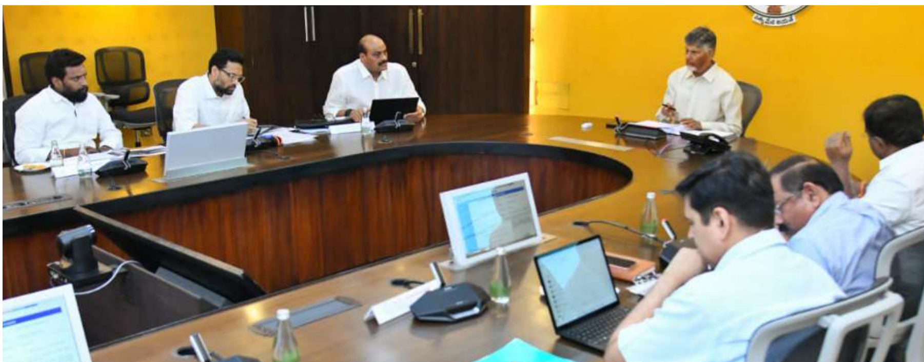
వన్ ఫ్యామిలీ- వన్ ఎంట్రప్రెన్యూర్లో ఎంఎస్ఎంఈలు కీలకం

సచివాలయంలో జరిగిన 17వ ఎన్ఐపీబీ సమావేశంలో 25 ప్రాజెక్టులకు చెందిన రూ.2,01,023 కోట్ల పెట్టుబడులకు ఆమోదం తెలిపారు. ఈ ప్రాజెక్టుల ద్వారా 39,067 మందికి ఉద్యోగ అవకాశాలు లభించనున్నాయి. సమావేశంలో