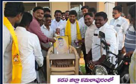
కడప జిల్లా కమలాపురంలో