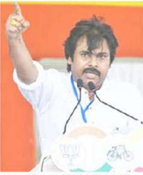
పట్టు. తప్పు జరిగినప్పుడు ఎదిరించకపోతే మన భవిష్యత్తు దెబ్బతింటుంది. జై ఉత్సాహం

పాలకొండ: ప్రభుత్వ భవనాలకు వైకాపా రంగులు వేయడానికి రూ.1300 కోట్లు తీసియడానికి రూ.వెయ్యి కోట్లు ఖర్చు పెట్టారు.. రంగుల పిచ్చితో వైకాపా ప్రభుత్వం రూ.2,300 కోట్లు రుబారూ చేసినందు బనసేన అధినేత పవన్ కల్యాణ్ విమర్శించారు. అందులో రూ.220 కోట్లు వెచ్చిస్తే తోటపల్లి రిజర్వాయర్ ఎడమ కాలువ పూర్తయ్యేదన్నారు. పార్లమెంటు మున్యం జిల్లా పాలకొండలో గురువారం నిర్వహించిన వారాహి విజయయాత్ర సభలో పవన్ ప్రసంగించారు. సీకేబీలు యువత భగభగ మందే నిప్పుకవేకలు.. తెగించి పోరాడాలి. 1960లో భామిని మండలంలో జగన్ లాంటి దొపిడీదారుల దాష్ట్యాల తట్టుకోలేక ఉత్సాహం ప్రజానీకం తిరగబడింది. ఆ తోటలు మళ్లీ వస్తాయని జగన్ కు చెప్పండి. గ్రామం.. సంగ్రామంగా మారడానికి ఎక్కడ సమయం