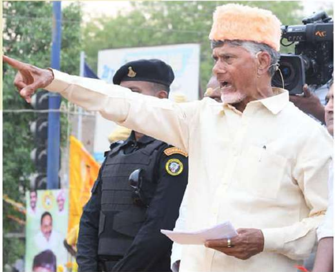
కాపాడతామని చంద్రబాబు హామీ ఇచ్చారు. మళ్లీ దుల్లన్, విదేశీ ఎడ్వై, రంజాన్ తోసా పునరుద్ధరిస్తామన్నారు.

తెలుగుదేశం హయాంలో ఎప్పుడైనా ముస్లింలకు అన్యాయం జరిగిందా? అని బాబు ప్రశ్నిస్తూ, మిర్చిన్ రెడ్డి ఎంపీగా ఉండి సీఎమ్, ఎన్ఆర్పీలకు ఎలా మద్దతు తెలిపారని నిలదీశారు. ఎన్డీలో తెలుగుదేశం ఉన్న పుడే ఉర్దూ వర్సిటీ, హజీహౌస్ కట్టామని, విభజిత రాష్ట్రంలోనే కడపలో హజీహౌస్ లు 90 శాతం పూర్తి చేస్తే, జగన్ మిగిలిన 10 శాతం పనులు పూర్తి చేయ లేకపోయాడన్నారు. హజీ యాత్రకులకు రూ.లక్ష సాయం అందిస్తామని, పాడిభావాల, మసీదుల మర ముత్తలకు నిధులు కేటాయిస్తామన్నారు. సూరభాషా కార్పొరేషన్ ద్వారా రూ.100 కోట్లు ఇస్తామంటూ, మైసూరి కార్పొరేషన్ ద్వారా రూ.50 కోట్లకు పట్టణ ని రూణా ఇప్పిస్తామన్నారు. జమామ్, బోజన్ లకు రూ.10వేలు, రూ.5వేల గౌరవ వేతనం ఇస్తామన్నారు. 4 శాతం రిలీఫ్ కోసం సుప్రీంకోర్టులో పోరాడి