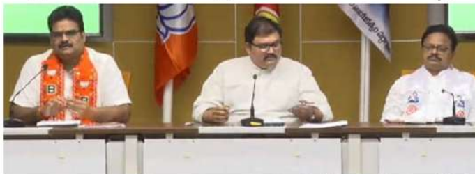
జగన్ అధిగణి రూ.8 లక్షలు కోట్లు

అమరావతి(వైతన్యరథం): ఇది ప్రజల గళం నుండి వచ్చిన ప్రజా మేనిఫెస్టో.. అందుకే ప్రజలందరూ కూటమి మేనిఫెస్టోను ఆదరిస్తున్నారని ఎన్డీఏ కూటమి నేతలు స్పష్టం చేశారు. జగన్ రెడ్డి తన తొత్తులతో కలిసి రూపొందించిన మేనిఫెస్టో అట్టర్ ఫ్రైడ్ అయింది.. అందుకే దాన్ని చిత్తూరుగోలం అనడం చెత్తబట్టలో వేస్తున్నారని అది కూటమి నేతలు వివరించారు. మంగళగిరిలోని టీడీపీ జాతీయ కార్యాలయంలో కూటమి నేతలు గురువారం మీడియాతో మాట్లాడారు.