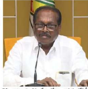
రెడ్డి వాటా రూ.50 వేల కోట్లు. ఇసుక దోపిడీ దుబ్బంతో ఓట్లను కొని తిరిగి అధికారంలోకి రావాలనుకుంటున్నారు. అక్రమ దుబ్బలను ప్రజలు తీసుకోరు. జగన్ రెడ్డి మూర్ఖం చెల్లించి కక్కిస్తాడు. కూటమి అధికారంలోకి వచ్చిన వెంటనే ఇసుక దండంను సహకరించిన అధికారులు, జే గ్యాంగ్ జైలుకు పోవడం ఖాయమని కొనకళ్ల స్పష్టం చేశారు.

కూటమి అధికారంలోకి రాగానే ఇసుక దండాపై విచారణ జరిపి తిన్నదంతా కక్కిస్తాం. జగన్ హయాంలో ఇసుక ధర మూడు రెట్లు పెంచారు. టీడీపీ పాలనలో వెయ్యి రూపాయలు ఉన్న ట్రాక్టర్ ఇసుక ధర నేడు రూ.3000లకు చేరింది. ఇసుక అక్రమ తవ్వకాల కారణంగానే అస్పష్టమయ్యి దాన్ని కోట్లకు పోయింది. ఆ కాలంలో 40 మంది చనిపోయారు. వారి దావులకు కారణం జగన్ రెడ్డి. అక్రమ ఇసుక దండంలో జగన్