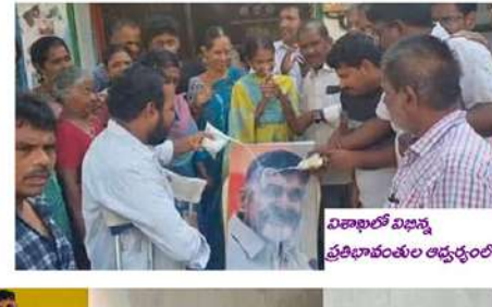
విఠాఖిలో విభాగ ప్రతిభావంతుల ఆధ్వర్యంలో