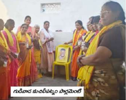
గుడివాడ మంచినీటిపట్టం పార్లమెంట్