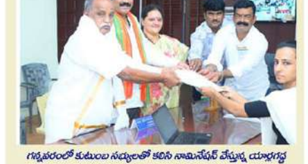
గన్నవరంలో కుటుంబ సభ్యులతో కలిసి నామినేషన్ల వేస్తున్న యాదగడ్డ