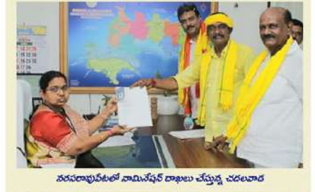
నరసరావుపేటలో నామినేషన్ల దాఖలు చేస్తున్న చదలవాడ