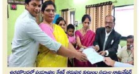
ఉరవకొండలో పర్యాయంల తేజవ్ తరుపున కుటుంబ సభ్యుల నామినేషన్