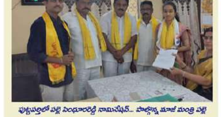
పుట్లపల్లిలో పల్లి నింధూరెడ్డి నామినేషన్... పాల్గొన్న మాజీ మంత్రి పల్లి