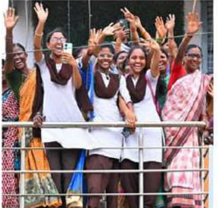
ప్రజలు కష్టాల్లో ఉన్నప్పుడు నా కుటుంబం అందగా ఉంది

మాతవదనీ పరిశ్రమలను తెరిపించి ఉద్యోగానిస్తాం పాలకొండ రోడ్డు బ్రహ్మాండంగా తీర్చిదిద్దడాని, రాజాం దివిగి రోడ్డు తీర్చుకున్నామని చంద్రబాబు హామీ ఇచ్చారు. మాతవదనీ పరిశ్రమలను తెరిపిస్తాం. డిడ్కో ఇళ్లను వెంటనే ఇస్తాం. పేదవాళ్ల అందరికీ 2 సంఖ్య భూమిని ఇప్పిస్తాం. కేంద్రంతోపాటు ఆంధ్రప్రదేశ్ ప్రభుత్వం పునరుద్ధరిస్తామని చెబుతాం. ఇప్పుడు జగన్ ఇచ్చిన ఇళ్లను రద్దు చేయకుండా వాటిని కొనసాగిస్తాను. నాగావళి బలం రెండుపై వంతన పూర్తి చేస్తా, తోటపల్లి ప్రాజెక్టు కారణం పూర్తి చేస్తాను. జగన్ రద్దుచేసిన సంక్షేమ పథకాలను పునరుద్ధరిస్తామని చెబుతాం. చెల్లుకు పోసిన నీరు ఎలా వచ్చా కాదో ఎప్పటికీ వేసిన ఓటా వచ్చా కాదు, మీకు ఫలానిస్తుంది అని చంద్రబాబు వ్యాఖ్యానించారు.