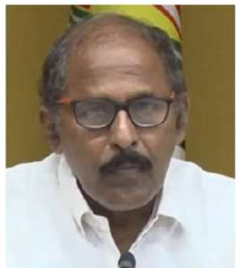
వరకు విద్యార్థులకు టిక్యెట్లను టైంలీ చేసే బాధ్యత 600 కోట్ల రూపాయలకు పాత కాంట్రాక్టుతో ఇచ్చి దోచుకున్నారని విమర్శించారు. దాని మీద జగన్