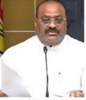
మహిళా మండలి సీఎం ఫోటో తొలగించండి. అయితే ఎన్నికల కోడ్ ఉల్లంఘించిన ఉద్యోగిపై వేటు.

అయితే ఎన్నికల కోడ్ ఉల్లంఘించిన ఉద్యోగిపై వేటు. అయితే ఎన్నికల కోడ్ ఉల్లంఘించిన ఉద్యోగిపై వేటు.