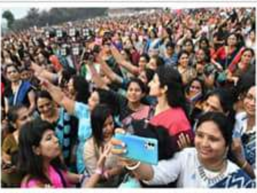
కేసులుగా పెంచడం చేశారు. ప్రోగ్రాం నిర్వహించు అన్ని కేసుల్లో అయితే నారామణ్ హాజరు ఉంది. మహిళలు తీరని ప్రతిఘటన చేశారు.

ప్రారంభించిన నారా బ్రాహ్మణ్ - వేల సంఖ్యలో హాజరై, వరుగులు తీసిన మహిళలు. ప్రారంభించిన నారా బ్రాహ్మణ్ - వేల సంఖ్యలో హాజరై, వరుగులు తీసిన మహిళలు.