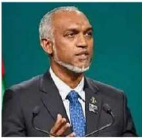
బలగాల మొహరింపును సంబంధించి భారత్తో ఒప్పందాన్ని పునరుద్ధరించుకో లేమని చెప్పారు. ఈ బలగాల ఉపసంహరణపై రెండు దేశాల ఒక అవగా హాసం వచ్చినట్లు ఇప్పటికే

మాత: భారత్ వ్యతిరేక వైఖరిని ప్రదర్శించడంలో హాల్బీషులు అధ్యక్షుడు మన్మోహన్ ముఖ్యమంత్రి వెనకేకగడం లేదు. గత కొంత కాలంగా రెండు దేశాల మధ్య దౌత్యపరమైన ఉద్రిక్త పరిస్థితులు నెలకొన్న సంగతి విదితమే. ఈ నేపథ్యంలో మాల్దీవులు పాపమెంటోలో ముఖ్యమంత్రి ప్రసంగంపై తమ సారథి మోదీకి సమాధానం విషయంలో వేరే దేశం జోక్యాన్ని తామెంతో మోచుకుంటున్నారని తెలిపారు. తమ దేశంలోని మూడు ప్రాంతాలకు స్థానికంగా ఉన్న 10వ కేంద్రీయ వైఖరికాయని, మిగిలిన రెండు స్థానికంగానే వుంటున్న భారత్ బలగాల మే 10 నాటికి వైఖరిని సమాధానం ముఖ్యమంత్రి తెలిపారు.