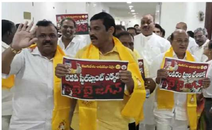
ఆపై మోగి దీవెనలు. దగా డీవెన్లు అని, ఈ ప్రభుత్వం రైతులకు అన్యాయం చేసిందంటూ పెద్ద ఎత్తున నివాదాలు చేశారు. ఆలోగే అంగన్వాడీలకు అన్యాయం చేశారంటూ వినించారు. అన్నీ అబద్ధాలు... అసత్యాలు సారే అంటూ టీడీపీ సభ్యులు నివాదాలు చేశారు. గవర్నర్ ప్రసంగాన్ని వివరిస్తే

అమరావతి: ఏటీ అసెంబ్లీలో గవర్నర్ ప్రసంగం జరుగుతుండగానే అబద్ధాలు వినలేకపోతున్నామంటూ టీడీపీ సభ్యులు సోమవారం సభ మంది వాకాట్ చేశారు. సమావేశాల నుంచి బయటకు వచ్చేశారు. అసెంబ్లీలో గవర్నర్ ఆబ్దుల్ నతీర్ ప్రసంగం మొదలైతేనే నుంచి వచ్చి అంశాలపై టీడీపీ సభ్యులు అభ్యంతరం తెలుపుతూనే ఉన్నారు. ముందుగా జగన్మోహన్ రెడ్డి డివైవ్ క్రింద పూర్తి రియంబర్స్ మెంట్ ఇచ్చామని గవర్నర్ చెప్పాడు.. పూర్తి రియంబర్స్ మెంట్ అంతా అబద్ధమంటూ తెలుగుదేశం సభ్యులు నిరసన తెలిపారు.