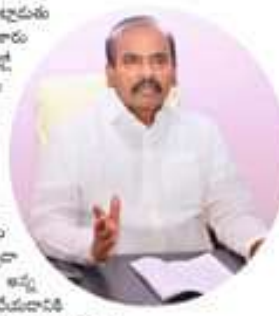
జగన్ ఓటమిని ఖాయం చేస్తూ ప్రభుత్వంలో సోపానం పుకార్లు వినిపిస్తున్నాయి.

పాల్గొన్న అందరినీ చూడగానే జగన్ ఓటమిని ఖాయం చేస్తూ ప్రభుత్వంలో సోపానం పుకార్లు వినిపిస్తున్నాయి. జగన్ ఓటమిని ఖాయం చేస్తూ ప్రభుత్వంలో సోపానం పుకార్లు వినిపిస్తున్నాయి.