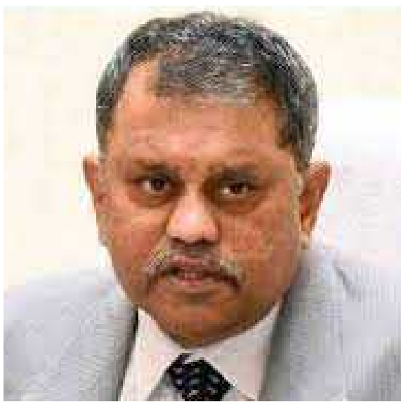
అక్రమంగా కేసులు బనాయించే హక్కు పోలీసులకు లేదు. అలా చేస్తే ప్రజల హక్కులను హరించడమే అవుతుంది. రాష్ట్ర పోలీసులు విచక్షణతో

అందించింది. ఆ తర్వాత సంస్థ యాజమాన్యం చేతులు మారింది. అప్పటి నుంచి దాని పనితీరుపై ఆరోపణలు వస్తున్నాయి. సామాజికంగా ప్రభావితం చేయగలవారిని ఐప్యాక్, రామ్ ఇన్ఫో వంటి సంస్థలు గుర్తిస్తున్నాయి. ప్రభావితం చేసేవాళ్లను సామ, దాన, భేద, దండో పాయాలతో లొంగదీసుకుంటున్నారు. ఇటీవల ఎఫ్ఐఆర్లు అత్యధికంగా నమోదవుతున్నాయి. ఎఫ్ఐఆర్లను బెదిరింపు అస్త్రం గా వాడుతున్నారన్న ఆరోపణలు ఉన్నాయి. ఎఫ్ఐఆర్ల నమోదుపై ఓ కమిటీ వేయాలని సీఎఫ్డీ భావిస్తోంది. విశ్రాంత పోలీసు అధికారులతో ఎఫ్ఐఆర్ల నమోదుపై పరిశీలనచేయించే ఆలోచన ఉంది. కమిటీ విచారణలో తేలివచ్చిన వాస్తవాలను మానవహక్కుల కమిషన్ (హెచ్పార్సీ) ముందు ఉంచుతాం. బూత్ స్థాయిలో కీలకంగా వ్యవహరించే విపక్షాల నాయకులను కేసులతో బెదిరించే యత్నాలు జరుగుతున్నాయని తెలుస్తోంది.