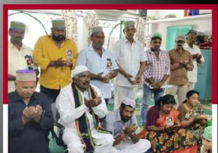
రాజోలు మనీడ్ లో గొల్లపల్లి ప్రత్యేక ప్రార్థనలు