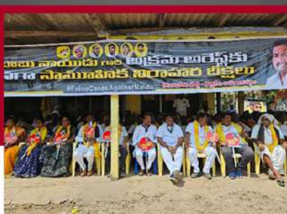
కొత్తపేట నియోజకవర్గంలోని రాఘవపాలెంలో లలె బిక్ష