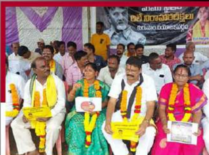
కురుమాంలో టీడీపీ శ్రేణుల ఆందోళన