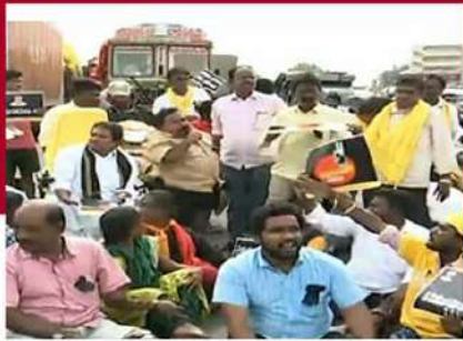
చిలకలూరిపేటలో జాతీయ రహదారిపై బైరాయించిన దివ్యాంగులు