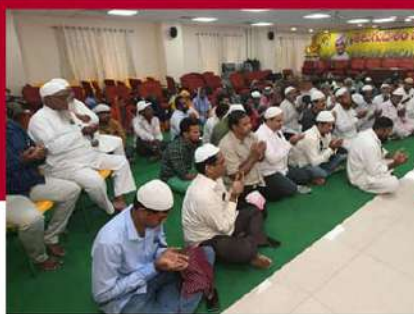
విశాఖలో మైనార్టీ కార్యకర్తల దుమా