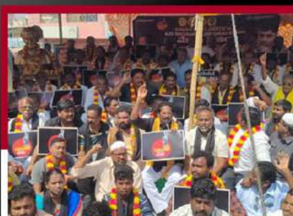
వినుకొండలో జీవీ ఆంజనేయులు ఆధ్వర్యంలో