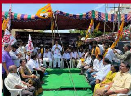
మంగళగిరిలో టీడీపీ దీక్షకు జనసేన సంఘీభావం