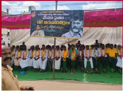
అక్షగడ్డలో లలె నిరాహార బిక్ష చేపట్టిన టీడీపీ శ్రేణులు