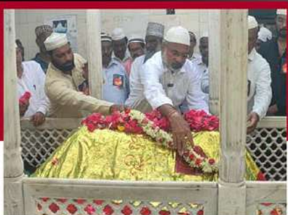
కాకినాడలో ప్రత్యేక ప్రార్థనలు నిర్వహిస్తున్న కనకూడి కొండబాలు