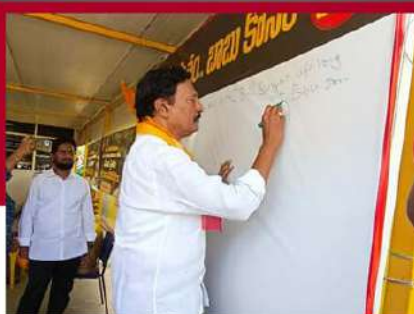
బాబుతో నేను అంటూ సంతకం చేస్తున్న గద్దె