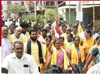
ద్వారకా తిరుమలలో నిరసన ర్యాలీ చేపట్టిన మద్దిపాటి