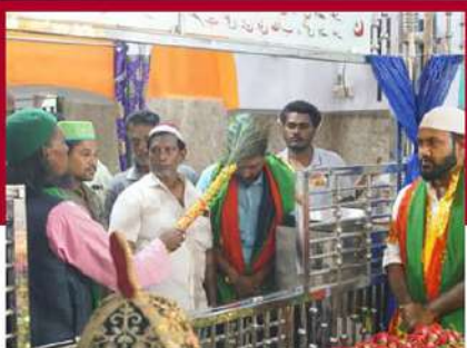
కొవ్వూరు మసీదులో ప్రార్థనలు