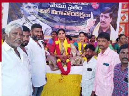
బనగానపల్లెలో జి.సి. ఇందిరా ఆందోళన