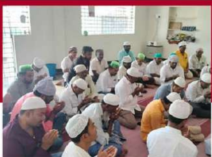
బద్వోలో ప్రత్యేక ప్రార్థనలు చేపట్టిన మైనార్టీ సోదరులు