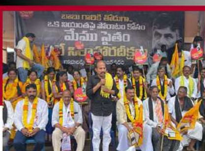
గోపాలపురంలో మాజీ మంత్రి జవహర్