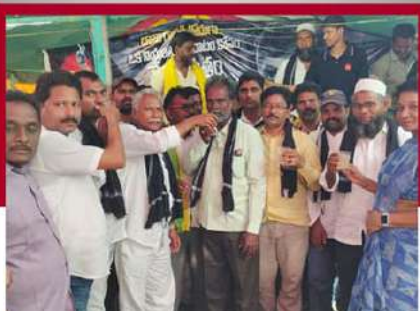
తుళ్లపాడులో నిష్కరసం తీసుకుంటున్న శ్రేణులు