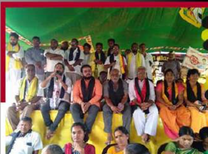
నర్సవల్లింలో రలే దీక్ష చేపట్టిన చింతకాయల విజయ్