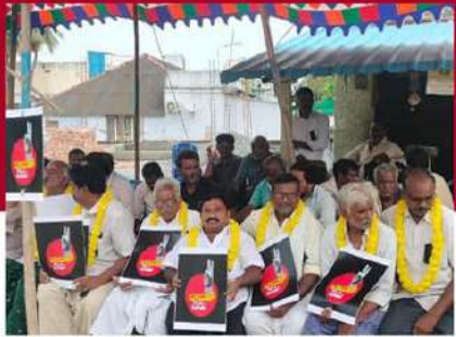
నరసరావుపేట రావిపాడులో శ్రీమల లిలేనిరాహార దీక్ష