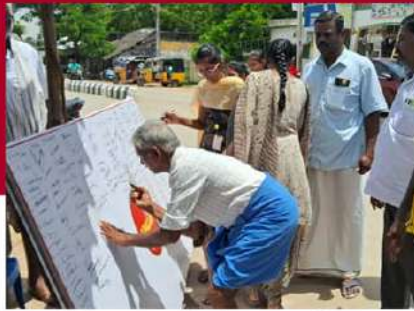
బాబుతో నేను అంటూ సగిలలో సంతకాలు చేస్తున్న ప్రజలు