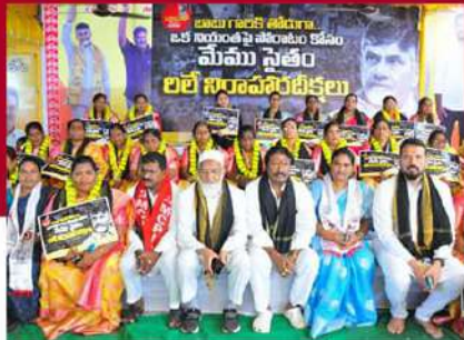
విజయవాడలో పశ్చిమ నియోజకవర్గంలో శ్రేణుల నిరసన