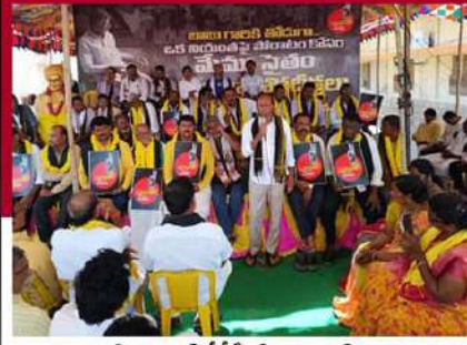
చీమకుర్తిలో టీడీపీ శ్రేణుల ఆందోళన