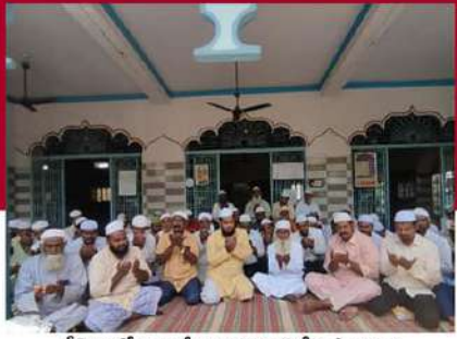
శ్రీశైలంలో మైనార్టీ కార్యకర్తల ప్రత్యేక ప్రార్థనలు