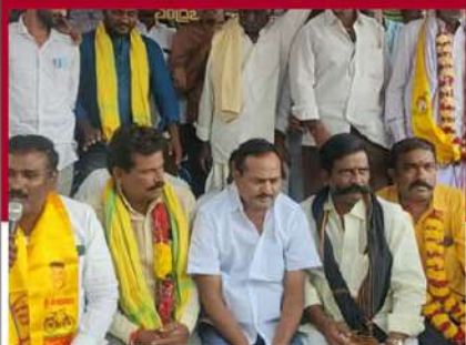
నందికొట్కూరులో టీడీపీ శ్రేణుల నిరసన దీక్ష