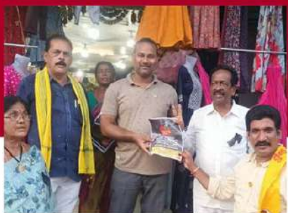
కొనసీమలో టీడీపీ ప్రచారం