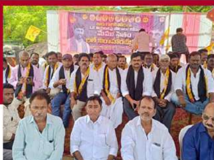
జమ్మలమడుగులో మూడో రోజు శ్రేణుల లలె నిరాహార బిక్ష