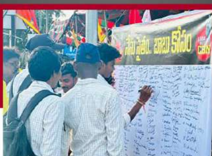
కొయ్యలగుడెంలో సంతకాలు చేస్తున్న విద్యార్థులు