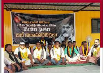
పొన్నం మండలంలో లలె నిరాహార బిక్ష చేపట్టిన కార్యకర్తలు