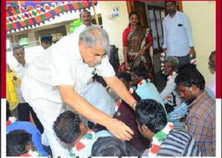
నందిగామలో దీక్ష చేపట్టిన వారికి సంఘభావం తెలుపుతున్న మాజీ మంత్రి సెట్టిం రఘురామ్