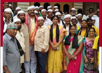
కాపలి మసీదులో టీడీపీ శ్రీమల ప్రార్థనలు