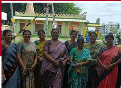
పెనమలూరులో తెలుగు మహిళా ఆందోళన