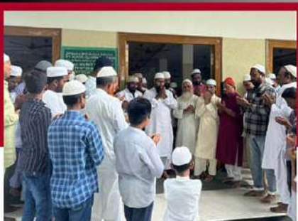
మార్కాపురంలో మైనార్టీ నేతల ప్రార్థనలు