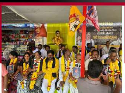
నిడదవోలులో టీడీపీ నేతల లలె నిరాహార బిక్ష