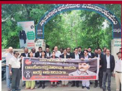
నరసరావుపేట కోర్టు వద్ద లాయర్ల ఆందోళన