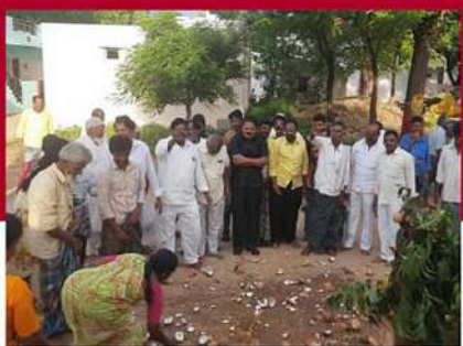
పుట్లపల్లిలో ప్రత్యేక పూజలు నిర్వహిస్తున్న పల్లె