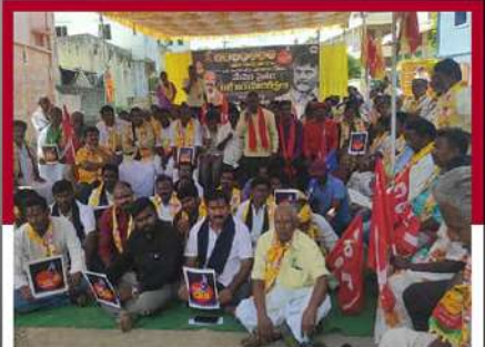
వెంకటగిరిలో శ్రీమల నిరాహార దీక్ష