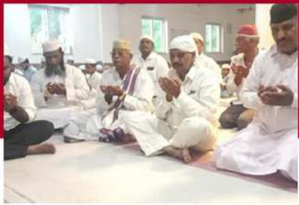
మేడికొండూరులో తెనాలి శ్రావణ్ ప్రార్థనలు