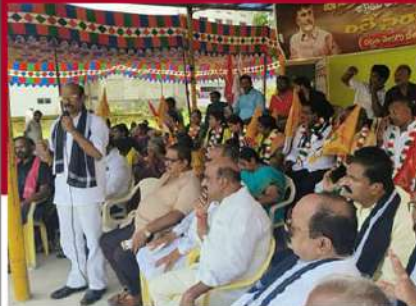
ఉయ్యూరులో వై.పి.బి ఆధ్వర్యంలో రిలే నిరాహార దీక్ష