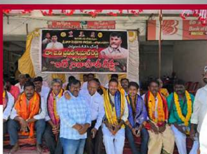
ప్రొద్దుటూరులో టీడీపీ శ్రేణుల లలె నిరాహార బిక్ష