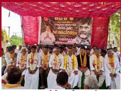
కమలాపురంలో శ్రీమల లిలే నిరాహార దీక్ష