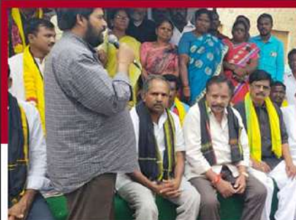
కడపలో టీడీపీ నేతల రలే నిరాహార దీక్ష