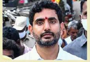
డీడిపీ సీనియర్ నేత, మాజీ మంత్రి అయ్యన్న పాత్రుడిని పోలీసులు అరెస్ట్ చేయడంపై యువ నేత నారా లోకేశ్ మండిపడ్డారు. అరెస్టులతో మా గొంతులను నొక్కలేవు జగన్ అని నిప్పులు చెరిగారు. నీ అణచివేతే మా ఆధునికాలు అని చెప్పారు. అయ్యన్న పాత్రుడి అరెస్ట్ జగన్ నైజ్ పాలనకు పరాకాష్ఠ అని దుయ్యబట్టారు.