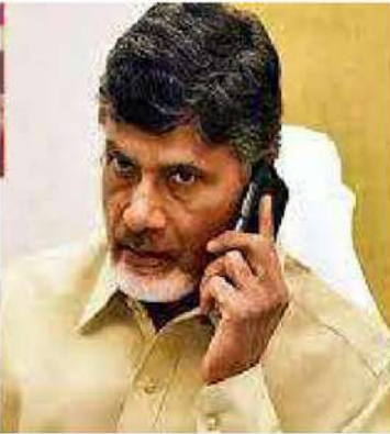
పోలీసులు అరెస్టు చేసుకుంటూ చివరకొంది.. కొడతారా కోట్లమ్మ... చంపేస్తారా చంపే యుండి రాష్ట్రం కోసం నసపోయేందుకు సిద్ధంగా ఉన్నామని అయ్యన్నపాత్రుడు వ్యాఖ్యలు చేశారు.

విశాఖపట్నం: తెదేపా సీనియర్ నేత, మాజీ మంత్రి చింతలయల అయ్యన్న పాత్రుడిని పోలీసులు విశాఖపట్నంలో అరెస్ట్ చేశారు. హైదరాబాద్ నుంచి ఎయిరిండియా విమానంలో విశాఖ ఎయిర్ పోర్టుకు చేరుకున్న అయ్యన్న కృష్ణ జిల్లా గన్నవరం పోలీసులు వచ్చి వాహనంలో ఎక్కించుకుని తీసుకెళ్లారు. అనంతరం తాజ్ హిల్స్ 41వ నోటీసులు ఇచ్చి అయ్యన్నను విడిచిపెట్టారు. తెదేపా జాతీయ ప్రధాన కార్యదర్శి నారా లోకేశ్ చేపట్టిన 'యువగళం' పాదయాత్రలో భాగంగా ఇటీవల ఎక్స్టింజ్ జిల్లా గన్నవరంలో నిర్వహించిన సభలో చేసిన వ్యాఖ్యలపై పలువురు తెదేపా నేతలపై కేసు నమోదైంది. వైసాపాకు చెందిన మాజీ మంత్రి పేర్ని నాని ఫిర్యాదుతో అయ్యన్నపాత్రుడుపై 153వ, 354వ(1), 504, 505(2), 500 ఐసీసీ సెక్షన్ల కింద పోలీసులు కేసులు నమోదు చేశారు. ఈ నేపథ్యంలో విశాఖలోని స్థానిక పోలీసులకు సమాచారం లేకుండానే ఎయిర్ పోర్టు నుంచి అయ్యన్నను తీసుకెళ్లి ఆ తర్వాత విడుదల చేశారు. అరెస్టుపై అయ్యన్న మాట్లాడుతూ... విశాఖ ఎయిర్ పోర్టుకు రాగానే హనుమాన్ జంక్షన్ నుంచి వచ్చిన పోలీసులు ఆడుపులోకి తీసుకున్నారన్నారు. ఇటీవల గన్నవరం సమావేశంలో చేసిన వ్యాఖ్యలపై ఆడపులోకి తీసుకుంటూ మాట్లాడుతూ... విశాఖ ఎయిర్ పోర్టు వద్ద వచ్చిన పోలీసులు ఆడుపులోకి తీసుకున్నారన్నారు. పైనుంచి పోలీసులకు ఫోన్ రావడంతో 41- ఏ నోటీస్ ఇచ్చి వది రోజులలో వచ్చి వివరణ ఇవ్వాలని చెప్పి వదిలేశారు తెలిపారు. రాష్ట్రంలో జరుగుతున్న డోకుటీ కోసం పోరాటం చేస్తున్నామన్నారు. పోలీసులు ఎప్పుడు రమ్మన్నా వచ్చేందుకు సిద్ధంగా ఉన్నట్లు చెప్పారు.