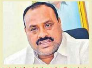
నిరంకుశ పాలనకు పరాకాష్ఠ: అచ్చెన్నాయుడు అయ్యన్న పాత్రుడి అరెస్ట్ జగన్ రెడ్డి నిరంకుశ పాలనకు పరాకాష్ఠ అని డీడిపీ రాష్ట్ర అధ్యక్షుడు కింజరాపు అచ్చెన్నాయుడు విమర్శించారు. గన్నవరం సభలో అయ్యన్న చేసిన వ్యాఖ్యల్లో తప్పి ముందని ప్రశ్నించారు. ప్రజా స్వామ్య మూలాలను జగన్ ద్వారం చేస్తున్నారు. ప్రభుత్వ ప్రజా వ్యతిరేక విధానాలను ప్రశ్నిస్తే అరెస్టు చేస్తారా అని అచ్చెన్నాయుడు మండిపడ్డారు.

ప్రభుత్వంపై అయ్యన్న విమర్శలే నేరమైతే... మంత్రులు, వైసీపీ నేతలు రోజూ చెప్పున్న వ్యాఖ్యలకు, విద్వేష ప్రసంగాలకు డీవీజాతం జైల్లో పెట్టాలని అన్నారు. అనమ్మక మాఫియా పాలకులను విమర్శించక ఏం చేస్తారు.. దైర్యం ఉంటే తప్పి వచ్చును అలోచనలకు సమాధానం చెప్పాలి అని అన్నారు. జగన్ చెప్పున్న తప్పులు, నేరాలే ఇలా అక్రమ కేసులు బనాయించడం ద్వారా పోలీసులు ధాగస్వాములు అయితే వాళ్లు తీవ్ర మాటలు చెల్లినారని చంద్రబాబు నాయుడు శుభ్రవారం ఒక ప్రకటనలో హెచ్చరించారు.