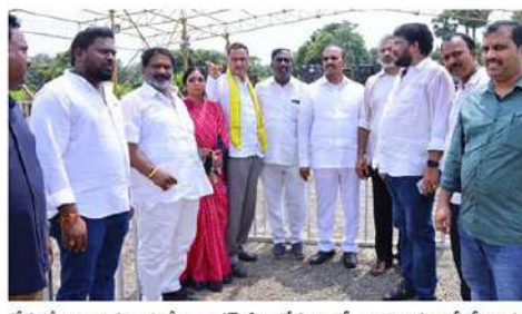
చేసుకోవాలన్నారు. ఈటోలు జగన్ ఏం చేస్తున్నారో.. అధికారం కోల్పోయిన మరుక్షణం జగన్ రెడ్డికి అదే జరుగుతుందన్నారు. సీఎం జగన్ ప్రభుత్వం చంద్రబాబు, లోకీకే ప్రజలంతా బ్రష్చర్ల పడుతున్నారని.. అది చూస్తూ జగన్ తన దుర్భిక్ష, దుర్భిక్ష అలోచనలు మార్చుకోవాలని సూచించారు. అది తర్వాత సమయంలో ప్రజావిశ్వాసాన్ని కోల్పోయిన ముఖ్యమంత్రిలో జగన్ ఉందంటున్నారని వ్యాఖ్యానించారు. తెలుగు ప్రజల్లో అత్యంత ప్రజారాజు కలిగిన నేతల్లో లోకీకే ముందు వరుసలో ఉండవలసివచ్చారు. ఇప్పటికైనా జగన్ తీరు మార్చుకోవాలని.. లోకీకే ప్రజలే తరిమికొట్టారని టీడీపీ నేతలు ప్రత్యేక విభిక్షాను, జ్యోతుల నవీన్ హెచ్చరించారు.

కాకినాడ (చైతన్యరథం) : గ్రామీణం తిమ్మపురం పంచాయతీ అసెంబ్లీ కూడలిలోని మీసాల రాజు ప్రాంగణంలో నేడు టీడీపీ అధినేత నారా చంద్రబాబునాయుడు అధ్యక్షతన జరగనున్న టీడీపీ జోన్-2 సమావేశం ఏర్పాట్లను టీడీపీ నేతలు బందారు నర్సయ్యారాజుమూర్తి, జ్యోతుల నవీన్ తో కలిసి ప్రత్యేక పరిశీలించారు. ఈ సందర్భంగా నేతలు మాట్లాడుతూ.. చంద్రబాబు రెండు పదవ పుట్టినరోజు ఛానంగా తొలుత జోన్-2 సమావేశం నిర్వహిస్తున్నట్లు చెప్పారు. జోన్-2 పరిధిలో 36 అసెంబ్లీ స్థానాల నుంచి నాయకులు హాజరవుతారని.. ఒక్కో నియోజకవర్గం నుంచి 70-100 మంది హాజరయ్యే అవకాశం ఉందన్నారు. బాబు ఛార్జీలతో -భవిష్యత్తుకు గ్యారంటీ రాల్చాకమాట్ ప్రజల్లోకి తీసుకెళ్లి విషయంపై చంద్రబాబు అవగాహన కల్పిస్తారని చెప్పారు. క్షన్ల, యూనిట్, బాత్ ఇన్ ఫర్మెంట్లు, సాధికార సాధనాలకు చంద్రబాబు దిశానిర్దేశం చేస్తారని అన్నారు. కుటుంబ జాడీతా పరిశీలన, హాస్తి మ్యూనింగ్, ఇబ్బందిపాలను చేసిన కార్యక్రమాలపై కూడా చంద్రబాబు సమీకరిస్తారని బందారు నర్సయ్యారాజుమూర్తి వెల్లడించారు. వైసీపీ ప్రభుత్వం అక్రమాలతో పాటు నాలుగున్నెళ్లలో తెడిపా శ్రేణులపై పెట్టిన కోతలపై కూడా చర్చిస్తారని అన్నారు. జంబూవీధులలో లోకీకే డిస్టికామ్ను ఉద్యోగిందం ఏంటని.. జగన్ డిస్టికామ్ను టీడీపీ నేతలు ఊరేగించారేనా? అని ప్రశ్నించారు. అధికారం ఎవరికి కాళ్ళందం వాదనపై విషయం జగన్ గుర్తించుకోవాలన్నారు. వైసీపీ ప్రభుత్వాన్ని తరిమికొట్టడానికి ప్రజలు సిద్ధంగా ఉన్నారని అన్నారు. జగన్ మాట్లాడిన దానికి మించి టీడీపీ నేతలెవరు మాట్లాడలేదని.. జగన్ కూడా అక్కణివచ్చు