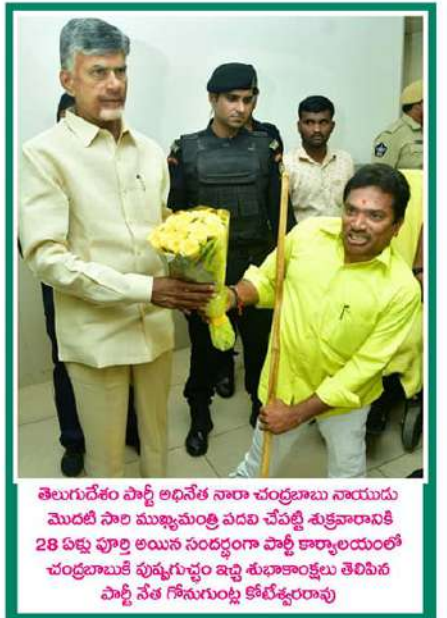
తెలుగుదేశం పార్టీ అధినేత నారా చంద్రబాబు నాయుడు మొదటి సారి ముఖ్యమంత్రి పదవి చేపట్టి శుక్రవారానికి 28 ఏళ్లు పూర్తి అయిన సందర్భంగా పార్టీ కార్యాలయంలో చంద్రబాబుకు పుష్పగుచ్ఛం ఇచ్చి శుభాంశాలు తెలిపిన పార్టీ నేత గోసుగుండ్ల కోటిశ్రీకృణ్దరావు

భయం ఎక్కువగా ఉంది. ఇక ఎన్నికల ఖర్చులో కూడా స్థానిక పార్టీలు జాతీయ పార్టీలతో పోటీపడాలి రావడం ఇష్టంలేదని మారుతుందనే అనుమానాలున్నాయి. 2015లో జరిగిన ఓ సర్వే ప్రకారం, జమిలి ఎన్నికలు నిర్వహిస్తే.. 77 శాతం మంది ప్రజలు ఒకే పార్టీ లేదా కూటమిని ఎన్నుకునే అవకాశాలున్నాయి. అదే అసెంబ్లీ, పార్లమెంట్ ఎన్నికలు జరు వెలు తేడాతో నిర్వహిస్తే ఒకే పార్టీని ఎన్నుకునే అవకాశాలు 61 శాతానికి తగ్గిపోతాయని తెలిపింది. 1967 వరకు ఈ విధంగానే కేంద్ర, రాష్ట్ర ప్రభుత్వాల కోసం ఒకేసారి ఎన్నికలు నిర్వహించారు. కానీ, ఆ తర్వాత కొన్ని రాష్ట్రాల అసెంబ్లీలు రద్దవుతుండగా, 1970లో ఏడాది ముందే లోక్సభ రద్దు వంటి పరిణామాలతో ఈ విధానం కొనసాగించడం సాధ్యం కాకపోయింది. 1983లో ఎన్నికల కమిషన్ మరోసారి జమిలి ఎన్నికల ప్రతిపాదన తెరపైకి తెచ్చింది. కానీ, అప్పట్లో ప్రభుత్వం అసెంబ్లీ చూపలేదు. 1990లో లా కమిషన్ నివేదిక దీనిని మరోసారి తెరపైకి తెచ్చింది. 2016లో ప్రధాని మోక్షం అలోచనను మరోసారి ప్రతిపాదించారు. ఆ మరుసటి ఏడాదే దీనిపై సీఐ అయ్యాగ్ కమిటీని చేసింది. 2019లో ఈ అంశంపై ప్రధాని వివిధ పార్టీల నేతలతో సమావేశం ఏర్పాటు చేయగా.. కాంగ్రెస్ సహా చాలా పక్షాలు దీనికి దూరంగా ఉన్నాయి. అఖిల జాతి పార్టీలు మాత్రమే ప్రతిపక్షంగా వుంటాయి. 2022లో కామ జమిలి ఎన్నికలు నిర్వహించే సందర్భానికి సురీల్ చంద్ర ప్రకాశ్ దీనిని మరోసారి తెరపైకి తెచ్చారు. 2022 ఏప్రిల్ లో ఈ రకం ఎన్నికలపై లాకమిషన్ వివిధ పార్టీలు, ఈసీ, అధికారులు, విద్యావేత్తలు, నిపుణులు అభిప్రాయాలను ఆహ్వానించింది.