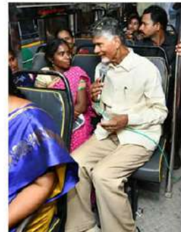
విధానాలు అనేమీ అన్నివరాల ప్రజలకు మందిచేసేలా ఉండాలి. టీడీపీ ప్రభుత్వం రాగానే మీ ఆదాయం పెంచేలా కొత్త విధానాలు అమలుచేస్తానని టీడీపీ అధినేత హామీ ఇచ్చారు.