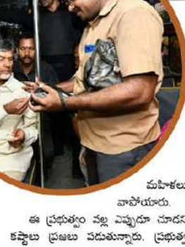
మహిళలు వాపోయారు. ఈ ప్రభుత్వం వల్ల ఎప్పుడూ నూదని కష్టాలు ప్రజలు పడుతున్నాయి. ప్రభుత్వ

పెంచాలి స్వల్ప కన ఆలోచన అని చంద్రబాబు తెలిపారు. వైసీపీ వాళ్లకు తప్ప ఇతర పార్టీల వాళ్లకు ఎలాంటి పథకాలు అందిందడం రేదని పెంకిపాడు గ్రామ గృహిణి తెలిపారు. తన భర్త ఫోటోగ్రాఫర్ అని, బదులుగ సభ్యులున్న కుటుంబం ఒక్కటి సంపాదనపైనే ఆధార పడిందని వివరించారు. సామాజిక పీఠభం పెంచలేదని, విద్యుత్ బిల్లులు భారీగా పెంచారని, గతంలో రూ.2వేలు వచ్చే బిల్లు బస్సులు రూ.6 వేలు వస్తోందని పలువురు