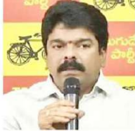
డెయిలీలకు న్యాయంచేస్తే రాష్ట్రం బాగుపడుతుంది. చిత్తూరు డెయిలీని అమూల్ నంస్ కు కట్టబెట్టడం క్షియరెస్సెలో భాగమే. డి.టి.టి ప్రభుత్వం వచ్చినవెంటనే జగన్మోహన్ రెడ్డి కేజరివల్ పరంగా తీసుకున్న ప్రతినిర్ణయాన్ని సమీక్షిస్తుంది. ప్రజలఅస్సలు. భూములు, ప్రభుత్వభూములు కొట్టినవారిని, వారికి సహకరించిన అధికారుల్ని వ్యవస్థల్ని డి.టి.టి ప్రభుత్వం వదిలిపెట్టడు. ముఖ్యమంత్రిని, మంత్రివర్గంను నిబంధనలు, చట్టాలకు తిలోదకాలిచ్చి ముందుకెళ్లవారందరికీ మున్లపందగ ముందు ఉంటుంది." అని బొండా ఉమామహేశ్వరరావు తెలిపారు.

పైనే కేజరివల్ త్రవ్వకాల్లోంది. 22 ఏ భూములు, ఇతరవివాదాల్లోని భూముల్ని తనపార్టీవారికి, తనపార్టీనికే కట్టబెట్టేందుకు జగన్ ఉమ్మక్కారు చున్నాడు. ఇప్పటికే విశాఖపట్టణం చుట్టూకట్టల ప్రాంతాల్లో రూ.40 వేలకోట్ల విలువైన భూములు మింగిపోయాయి. గుజరాత్ నంస్ అమూల్ ను అనేకకార్యాల అరెస్టు రిస్కుంటే, ఏవీ ప్రభుత్వం మాత్రం రూ.5 వేలకోట్ల ప్రజలసొమ్ముని కట్టబెట్టి మరీ రాష్ట్రంలోని పాడివరిత్రమను నాశనంచేయడానికి సిద్ధమైంది. రాష్ట్రంలోని పాడి రైతులకు లీటర్ కు 4 రూపాయలు ఇస్తానన్న దోసపిమ్మెండో ముఖ్యమంత్రి సమాధానంచప్పాలి. చిత్తూరుడెయిలీని సహా, దానిపరిధిలోని 29 ఎకరాలభూమిని జగన్మోహన్ రెడ్డి 99 ఏకరాలకు అమూల్ కు ఏజాకిచ్చాడు. రాష్ట్రంలోని పాడి రైతులు, సహకార సంఘాలు, పాడివరిత్రమపై ఆధారపడిబికికే కుటుంబాలు ఏవీ ముఖ్యమంత్రికి కనిపించడంలేదా? గుజరాత్ నంస్ కు మేలుచేస్తే ఏవీ సొమ్ములూ అసంస్కృత పోతుంది. ఏవీలోని పాడివరిత్రమకు, వారి