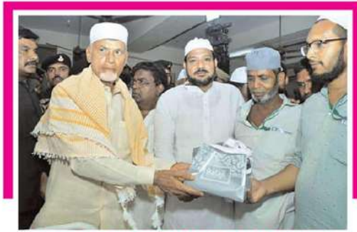
గుంటూరు జిల్లా నంబూరులోని హాజీ క్యాంప్ వద్ద హాజీ యాత్రికులకు శుభాకాంక్షలు తెలిపిన టీడీపీ అధినేత నారా చంద్రబాబు నాయుడు. ఈ సందర్భంగా యాత్రికులకు మిఠాయిలు, యాత్రలో ఉపయోగపడే వస్తువులతో కూడిన కిట్ను లంబించిన టీడీపీ అధినేత.

FIRST MULTIMEDIA E-PAPER IN ANDHRA PRADESH