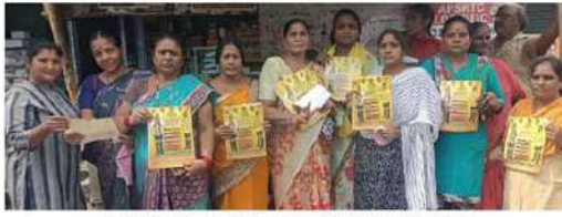
మహాశక్తి పథకాల కరపత్రాలను ప్రదర్శిస్తున్న మహిళలు