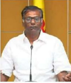
గానీ, వ్యవస్థలను తీసేవారికోసం చట్టాన్ని కుంగలో జొక్కవద్దని పోలీసులకు విజ్ఞప్తి చేస్తున్నామన్నారు."

వారు ప్రజలకు చూపించారు. కానీ పోలీసులకు మాత్రం వారంపట్టించుకున్నారు. రాష్ట్రంలో సామాన్యులకు, ప్రతిపక్షాలకు లా ఆండ్ ఆర్డర్ అమలుకాదు. వైసీపీనేతలు, కార్యకర్తలకోసం మాత్రమే అదినీత్రమంగా పనిచేస్తుంది. మరి ముఖ్యంగా టీడీపీనేతలకు ఏంజరిగినా అది భావప్రకటన స్వచ్ఛం కిందకే వస్తుంది. లేకపోతే ఏవో కట్టుకథలు అల్లుతారు. టీడీపీ నుంచి కానిస్టేబుల్ వరకు అందరినీ ఇదే తంతు. తమ విధానిర్వహణ వింటున్న పోలీసులు గుర్తించాలి. ప్రజలకోసం పనిచేయాలి