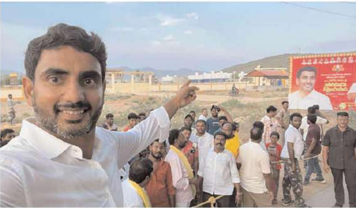
యువగళం పాదయాత్రలో ప్రజలు కవ్వలు తెలుసుకుని కనీళ్లు కుడుస్తూ ముందుకు సాగుకోస్తూ టిడిపి యువనేత