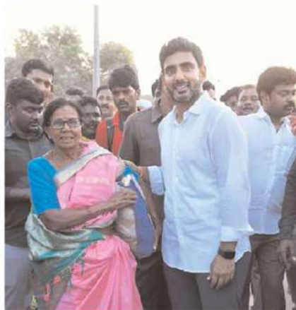
రాజంపేట నియోజకవర్గం టిక్కెట్లు, కడపాయపల్లి లింగపల్లి రైతులు యువనేత లోకేష్ ను కలిసిన సమస్యలను విన్నవించారు. మా గ్రామాలు తరచూ పెన్షన్లది ముంపుకు గురవుతున్నాయి. 1986లో ఎన్టీఆర్ సీఎంగా ఉన్నప్పుడు రాతి రక్షణగోడ నిర్మించారు.

కాలక్రమంలో వరద తీవ్రతకు ఈ గోడ దెబ్బతిని కొట్టుకుపోయింది. ఆ తర్వాత వచ్చిన ప్రభుత్వాలు ఈ సమస్యను పట్టించుకోలేదు. మా గ్రామాలు పల్లిలో వేల ఎకరాల భూములు వరదల సమయంలో మునుగుతున్నాయి. 1998లో మా గ్రామాలు వారం రోజులు జల బిగ్గంధంలో ఉన్నాయి మనుషులు. పశువులు, పంటలు కొట్టుకుపోయి తీవ్ర నష్టం సంభవించింది. మీరు అధికారంలోకి వచ్చాక పెన్షన్లదికి రక్షణ గోడ నిర్మించాలని కోరుతున్నాం. నారా లోకేష్ స్పందిస్తూ... ముఖ్యమంత్రి జగన్ కు దోచుకోవడం, రాచుకోవడంపై ఉన్న శ్రద్ధ సమస్యల పరిష్కారంపై లేదు. జగన్ స్పృహ దనదాహం