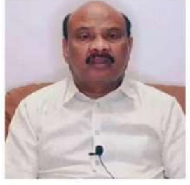
చేసుకున్నారు. మీరు ఎన్ని మారూమాటలు చెప్పినా మట్టి ప్రజలను మోసం చెయ్యలేరని ఆయన ఎద్దేవా చేశారు.

నేడు ఆలోచించి అమలు చేస్తారన్నారు. అదీ ఆయన గట్ట...విజన్. 4 దశాబ్దాల తెలుగుదేశం తెచ్చిన పాలసీలను తర్వాత దేశం పోలో అయ్యిందన్న విషయం నిన్న మున్ను రాజకీయాల్లోకి వచ్చిన మీకు ఎలా తెలుస్తుందిలే అన్నారు. మేం ప్రకటించింది మారూ ఘోషా కాదు. ఏవీ రాజకీయాల నుంచి వైసీపీని మాయం చేసే తిరుగులేని మేనిఫెస్టో అన్నారు. సాయిరెడ్డి చెప్పిన దాంట్లో ఒక్కటి మాత్రం నిజం ఉంది. అందరినీ అన్నవేళలా ఎవరూ మోసం చేయలేరు. ఒక్క ఛాన్సెలో మీరు చేసిన మోసాన్ని ప్రజలు పూర్తిగా అర్థం