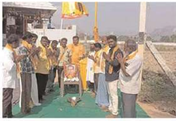
పిచ్చి నాయుడు పల్లి పంచాయతీలో