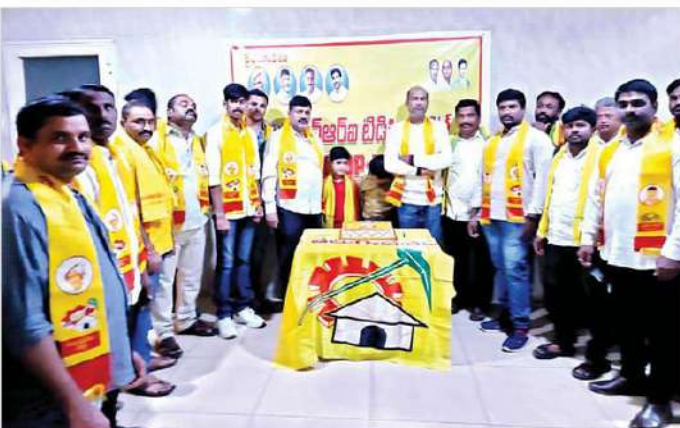
ఎన్నారై టీడీపి కుట్రలే ఆధ్వర్యంలో ఘనంగా ఆవిర్భావ దినోత్సవ వేడుకలు. పార్టీని టీడీపి అభిమానులు, కార్యకర్తలు

జాంటాను అధికారంలో ఉంచుతుంది. ప్రకటనకు ముందు, ఎన్నికల్లో పాల్గొనబోమని ఇప్పటికే ఎన్ఎంఆర్ సైన్యం చేసింది. ఈ ఎన్నికలు ఒక బాటకమని వేర్కొంది. పార్టీ ఎన్నికల సంఘంలో నవోదయ చేయడంలో విఫలమైందని మయన్మార్ డెమోక్రసీ తెలిపింది. అంగ్ దేశంలోని 39 ఇతర ప్రతిపక్ష పార్టీలు కూడా రద్దుప్రకటనలు చేశాయి. ఎన్ఎంఆర్ అధికార ప్రతినిధి యు క్యాన్ ఫ్టే మాట్లాడుతూ, ఎన్నికల సంఘం నుంచి ప్రకటన పద్ధినిపట్టికీ పార్టీ తన కార్యకలాపాలు కొనసాగిస్తుందని చెప్పారు.