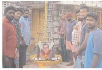
బుద్ధినాయుడు పల్లి పంచాయతీలో