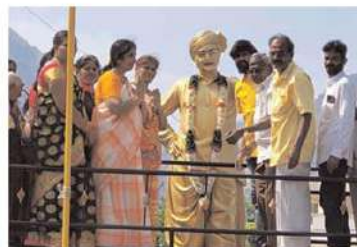
నారాహారి పల్లి పంచాయతీలో