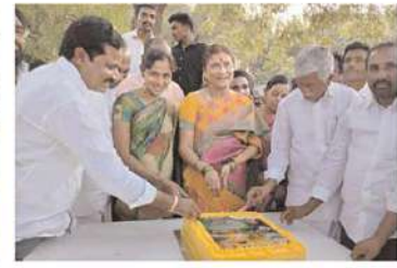
కడప పార్లమెంట్ బడ్డెట్ నియోజకవర్గంలో