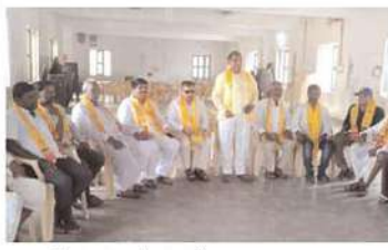
ఫాబాద్ మండల కేంద్రంలో