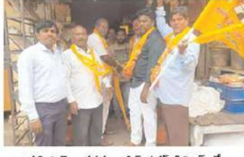
నాంపల్లి నియోజకవర్గం ఆసిఫ్ నగర్ డివిజన్ లో...