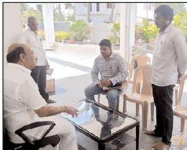
బీసీలపై మళ్ళీ కక్ష సాధింపు చర్యలు ఎమ్మెల్యే ఎస్.కె.ఎం. టి.బి.బి. బిల్లంమలైచేరేక జనీల మీద మళ్ళీ జగన్ కక్ష సాధింపుచేటం మొదలు పెట్టారు. నల్గొండపట్టణంలో తెలుగుదేశం రాష్ట్ర ప్రధాన కార్యదర్శి చింతకాయల విజయం ఇంటికి మళ్ళీ వచ్చిన విషయం పోలీసులు వచ్చి 28వ తేదీన మంగళగిరి విచారణకి హాజరుపాటుగా నోటీసులు జారీ చేశారని సమాచారం.