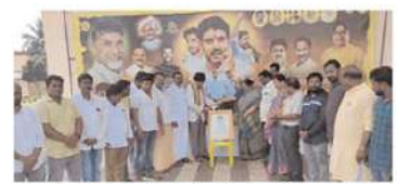
విజయం సాధించారని స్పష్టం చేశారు. జీసీలు ఎప్పుడు వెన్నుండంగా ఉంటూ జీసీ కార్యకర్తల ద్వారా వారికి ఆనందమైన రుజువు పనిముట్లు తెలుగు దేశ ప్రభుత్వం హయాంలో అందించడం జరిగిందన్నారు.

లక్ష్యంగా ఎన్నో సంక్షేమ పథకాలు అమలు చేయడం జరిగిందని, అదే సూత్రంతో పార్టీ జాతీయ అధ్యక్షులు నారా చంద్రబాబు నాయుడు ఆసీలకు రాజకీయ ప్రాధాన్యత కల్పించారని గుర్తు చేశారు. రాష్ట్రంలో రానున్న ఎన్నికల్లో డిడిపీ తప్పనిసరిగా విజయం సాధిస్తుందని, చంద్రబాబు నాయుడు తప్పనిసరిగా ముఖ్యమంత్రి అవుతారని తెలిపారు. అదేవల జరిగిన ఎమ్మెల్యే ఎన్నికల్లో జీసీలకు అధిక ప్రాధాన్యత ఇవ్వడం జరిగిందని మొన్న జరిగిన నలుగురు ఎమ్మెల్యేలలో ఇద్దరు జీసీలు ఇద్దరో రెడ్డి సామాజిక వర్గానికి చెందినవారు