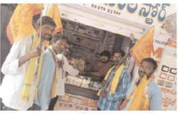
పరకాల నియోజకవర్గం గీసుకొండ మండలంలో..