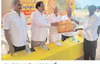
తుంగతుర్తి నియోజకవర్గం లో