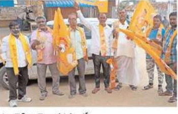
ఎల్లారెడ్డి నియోజకవర్గం లో