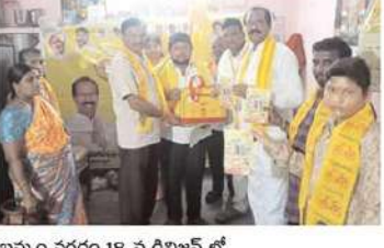
ఖమ్మం నగరం 18 వ డివిజన్ లో