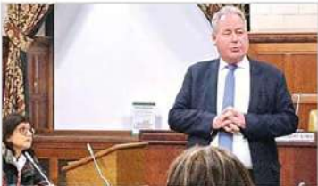
దాడులు జరిగాయని చెప్పారు. పన్నతం దేశంలో ఖలిస్తాని ఉద్దేశాలకు ఆశ్రయం ఇస్తున్నామని, ఈ బిల్లర్లులను నిషేధించే అంశంపై చర్చించాలని ఆయన సూచించారు. పెన్సి మోరార్ట్ తన ప్రతిస్పందనలో దాడిని ఖండించినందుకు బాబ్ బ్లాక్ మన్ కు ధన్యవాదాలు తెలిపారు. భారత హైకమిషన్ భద్రతను ప్రభుత్వం తీవ్రంగా

లండన్ - లండన్ లోని భారత హైకమిషన్ పై దాడి జరిగిన కర్ణాటక బ్రిటిష్ ఇలాంటి ఘటనలు జరగడం అవమానకరమని హోం ఎంపీ బాబ్ బ్లాక్ మన్ అన్నారు. లండన్ లోని భారత హైకమిషన్ భవనంపై ఖలిస్తాని పాకిస్తాని దాడిచేసిన విషయాన్ని ఎంపీ బాబ్ బ్లాక్ మన్ శుక్రవారం హౌస్ ఆఫ్ కామన్స్ లో లేవనెత్తారు. హైకమిషన్ పై దాడి జరగడం ఇది ఆరోపణ అని బ్లాక్ మన్ అన్నారు. భారత హైకమిషన్ వెలుపల అదివారం ఖలిస్తానీయులు చేసిన పాకిస్థాని దాడిని ఆరోపించి భారత హైకమిషన్ పై దాడి జరగడం ఇది ఆరోపణ అని బ్లాక్ మన్ అన్నారు. భారత హైకమిషన్ వెలుపల అదివారం ఖలిస్తానీయులు చేసిన పాకిస్థాని దాడిని ఆరోపించి భారత హైకమిషన్ పై దాడి జరగడం ఇది ఆరోపణ అని బ్లాక్ మన్ అన్నారు.