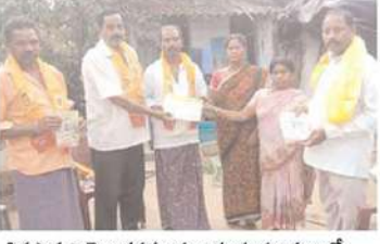
పినపాక నియోజకవర్గం మణుగూరు మండలంలో