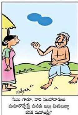
సీఎం గాంధీ, వారి సలహాదారులు మనపార్టీపై చురుకు అబ్బు దిగులున్నా కనక చుహులక్ష్మి?