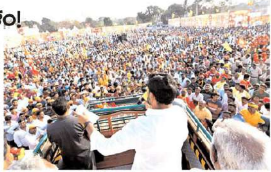
సైకో జగన్ పిల్లల ఉద్యోగాలు పీకేస్తాడు - యువగళం పాదయాత్రలో నారా లోకేష్

యువగళం పాదయాత్ర లో ఎన్నోమంది యువనేత సభకు చిత్తూరు పోలీసులు ఉద్దేశపూర్వకంగా అటంకాలు కలిగించారు. బస్టాండ్, ప్రధాన కూడళ్ల నుండి వచ్చే టీడీపీ కార్యకర్తలు, నాయకులకు ట్రాఫిక్ అంక్షలు విధించి