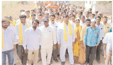
పెనుకొండ నియోజకవర్గం, గోరంట్ల మండలం, మల్లారపల్లి