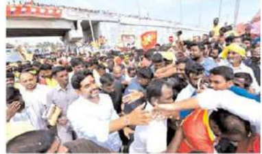
లోకేష్ ను వివిధ వర్గాల ప్రజలు, సంఘాలు కలుసుకొని వారి సమన్వయను వికరంపెట్టారు.

అడుగుడునూ జన నీరాజనం సమన్వయపై వినతులు స్వీకరించిన లోకేష్ పట్టణమంతా కిక్కిరిసిన జనసందోహం యువగళం వాదయాత్ర గురువారం పలమనేరు పట్టణం లోకి ప్రవేశించగానే అఖండ స్వాగతం లభించింది. పెద్ద ఎత్తున కరలి వచ్చిన ప్రజానీకం టిడిపి జాతీయ ప్రధాన కార్యదర్శి లోకేష్ పై పూలవర్షం కురిపించారు. మహిళలు మంగళహారతులు ఇచ్చారు. ఇటీవలికాలంలో ఎన్నడూ లేనంతగా ప్రజానీకం తరలి వచ్చింది. ఈ సందర్భంగా