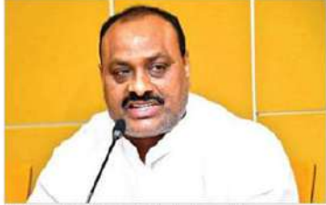
వ్యక్తిని బయటకు పిలిచి హత్యకు యత్నించడం వైశాచికత్వానికి సదర్శనం కాదా? నందితులను తక్షణమే అరెస్టు చేసి కఠినంగా శిక్షించాలని డిమాండు చేశారు.