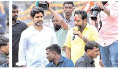
ముఖ్యమంత్రి అవుతారు. నలభై ఏళ్ల టిడిపి చరిత్ర ఒకరికక్కా వచ్చే వాలనలో ఒక లెక్క కనిపిస్తుంది.

గత మూడురోజులుగా ఈ పలమనేరులో యువనేత లోకేష్ వాదయాత్రకు అనుభూతమైన స్పందన లభిస్తోంది. ఇది చూసి జగన్ రెడ్డి గుండె బద్దలైంది. బైరెడ్డిపల్లిలో వైసీపీ వాళ్లు కడుపుమంటతో టిడిపి షేక్స్ లు దించారు. దమ్ము, ధైర్యం లేని పిరికిమందలు అధికారాల్లో రోడ్లపై షేక్స్ లు దించే నీచ సంస్కృతికి వైసీపీ వాళ్లు దిగజారారు. జగన్ దిక్కుమాలిన వరిపాలనపై మహిళలు ఉమ్ముతున్నారు. నీకు దమ్ముంటే నేరుగా రావాలి, తేల్చుకుందాం. గతంలో మార్కెట్ అంటూ నీ వెంట పడినవాళ్లకా నేడు లోకేష్ వాదయాత్రకు సంఘీభావం తెలుపుతున్నారు. చెత్తపనులు చేస్తూ జగన్ రెడ్డి వరుపు తీస్తున్నావు. ఇప్పటికైనా సిగ్గులేని పనులు మాని హుందాగా వ్యవహరించు. లేదంటే నా దమ్మేంటో చూపిస్తాం. వచ్చే ఎన్నికల్లో చంద్రబాబు