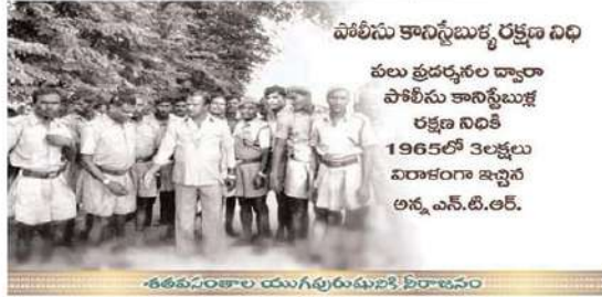
పోలీసు కానిస్టేబుల్స్ రక్షణ విభ

పలు ప్రదర్శనల ద్వారా పోలీసు కానిస్టేబుల్స్ రక్షణ విభాగం 1965లో 3లక్షలు వరకంగా ఇచ్చిన అన్న ఎన్.టి.ఆర్.