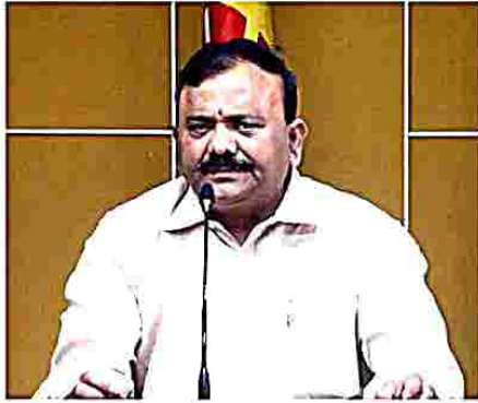
అహంకారంతో మదమెక్కి మాట్లాడుతున్నారు