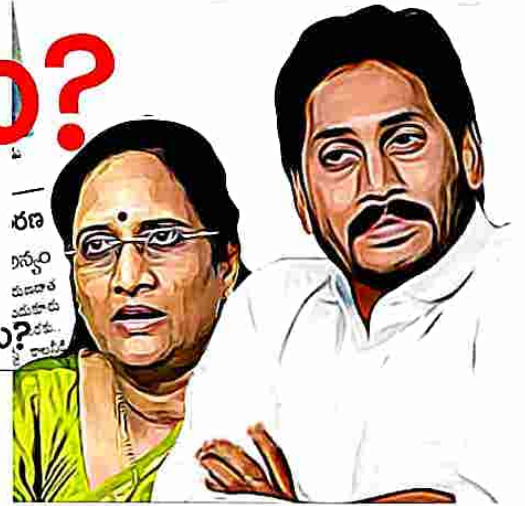
రణ గన్వం చూడాలి అయితే కాదు