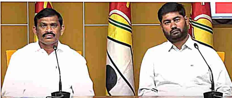
టీచర్ పోస్టుల భర్తీకి పూర్తిగా మంగళం