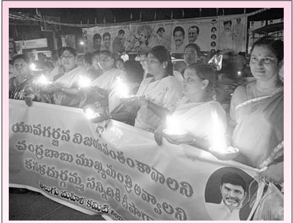
యువగర్జన విజయవంతమై చంద్రబాబు మళ్ళీ సీఎం కావాలని కోరుతూ విజయవాడలో కనదుర్గమ్మ సన్నిధికి ప్రమిదలతో ర్యాలీగా వెళ్ళున్న తెలుగుమహిళా కార్యకర్తలు.

నుంచి మేజర్ చంద్రకాంత్ వరకు ఆయన చెప్పిన డైలాగాలు, పాటలు ఇందులో ఉన్నాయి. సమాజం పట్ల ఆయనకున్న స్పృహ, ఆ మేరకు ఆయన చిత్రాల్లో ఉన్న సందేశాలను పొందుపరిచారు. 60వ దశకంలో నిర్మించిన జయసింహ చిత్రంలోనే తెలుగుదేశం అనే మాట ప్రస్తావనకు రావడాన్ని ప్రత్యేకంగా చూపించారు. పార్టీ ప్రస్తానాన్ని కూడా ఇందులో చూపారు. సుమారు 70 నిమిషాలు నిడివితో ఉన్న ఈ డాక్యుమెంటరీని సోమవారం చంద్రబాబు విడుదల చేశారు. దీంతోపాటు పార్టీకి సంబంధించిన అన్నిరకాల సమాచారం, ఎన్డీఆర్, బాలకృష్ణ, జూనియర్ ఎన్డీఆర్, తారకరత్న, కళ్యాణరామ్ తదితరుల సినిమాల వివరాలు, వాల్ పేపర్లు, రింగ్ బోన్లు, కాలరీట్యూన్ను తదితరాలతో రూపొందించిన www.tdpmobile.com అనే వెబ్ సైట్ ను కూడా ప్రారంభించారు.