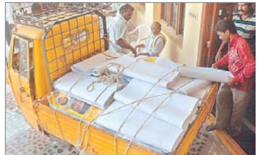
బాలకృష్ణ అభిమాన సంఘాలు ముద్రించిన యువగర్జన పోస్టర్లు