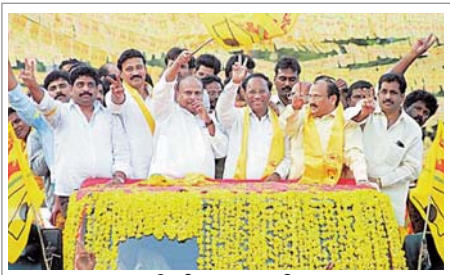
ర్యాలీలో పాల్గొన్న నేతలు

గతంలో సోనియాగాంధీ సభలకు బస్సులు తరలించినట్లే తమకు కూడా కోరారు. తెలంగాణపై ప్రజారాజ్యంపార్టీ వ్యవస్థాపకులు చిరంజీవి ప్రకటనలో స్పష్టతలేదన్నారు. ప్రత్యేక రాష్ట్రం ఇచ్చేది కేంద్ర ప్రభుత్వమే అన్న విషయం చిన్న పిల్లవాడిని అడిగినా చెబుతారని ఎద్దేవా చేశారు. తెలంగాణపై తెదేపా స్పష్టమైన ఖైఖరి చెప్పేదని ఇప్పుడు చిరంజీవి ప్రకటన వింటే తమకంటే 100 అడుగులు వెనక్కి వెళ్లిందన్నారు.